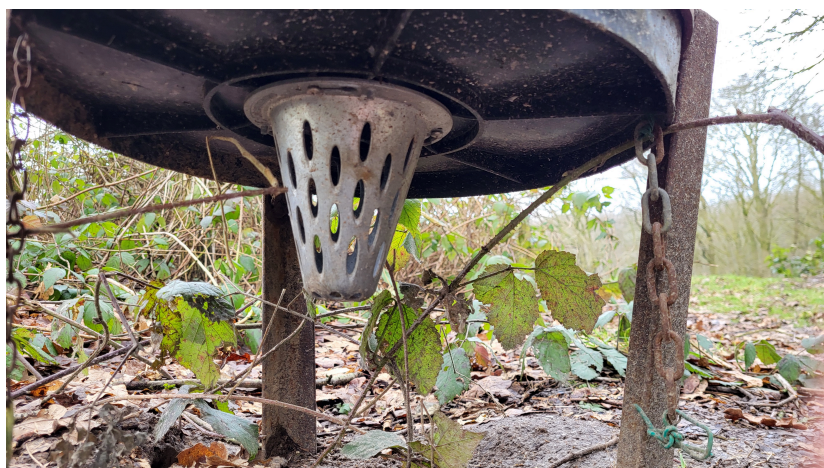
Les mangeoires installées un peu partout dans le territoire de chasse.

Comme sur la majorité des territoires qui pratiquent ces lâchers, les faisans sont importés et nourris sous volières pour ensuite être lâchés à peine un mois avant l'ouverture de la chasse le 1er octobre. Malgré les efforts du garde-chasse pour abriter les faisans dans de minuscules parcelles de maïs cultivées à cet effet, une fois lâchés, ils se déplacent jusque dans les jardins des riverains, se nourrissant sous les mangeoires à passereaux et se laissant même approcher à moins d'un mètre. Que dire du caractère sauvage des animaux lâchés !