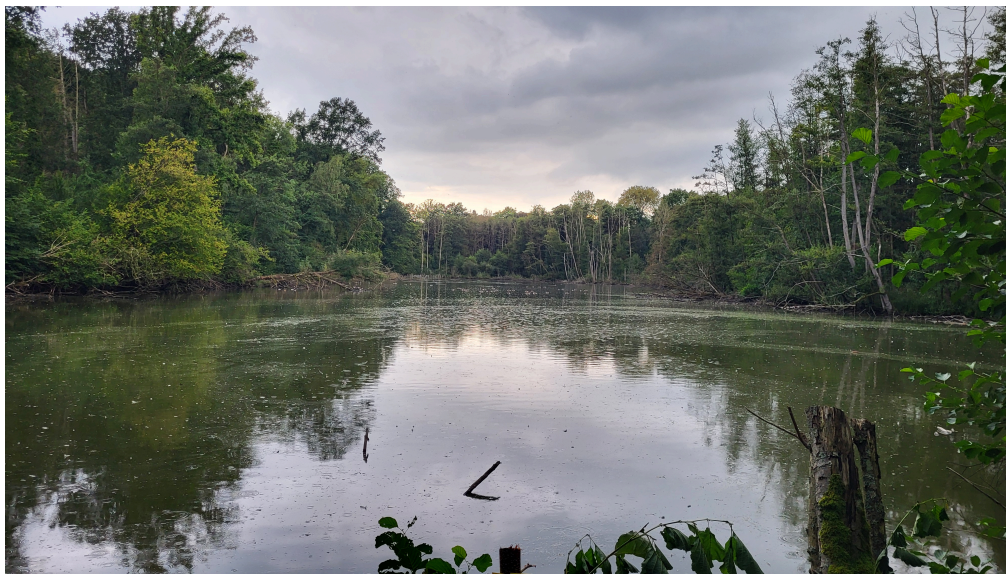
L'étang de Pallandt, havre de paix devenu un enfer pour les animaux et les riverains.

Alerté très tôt dans la saison, le collectif s'était déjà rendu à Genappe pour constater une importation massive de canards colverts sur un étang (situé en zone Natura 2000) d'à peine 1 ha de superficie. Outre les nuisances sonores et olfactives, ce territoire de chasse représentait également une aberration par rapport au réseau écologique wallon (étang eutrophisé, poissons en manque d'oxygène, espèces d'oiseaux absentes...).