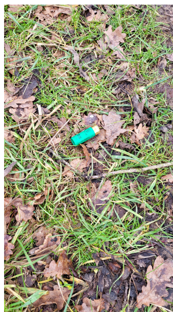
Munition de Plomb de la marque Caccia, retrouvée à Céroux

Pour rappel, le plomb est une matière terriblement toxique pour l'homme, la faune et la flore. C'est la raison pour laquelle son utilisation a été interdite dans l'essence, la peinture et les canalisations. Les munitions au plomb sont déjà interdites dans les zones humides de l'UE et l'Agence européenne des produits chimiques a suggéré d'étendre l'interdiction à tous les habitats.